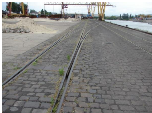
4. sz. Nyíltrakodói II. vágány átépítés előtt