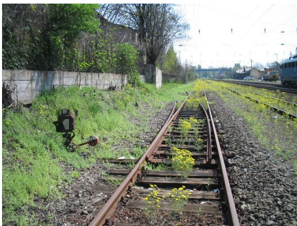
Bontandó Fonógyár vg. kiágazás