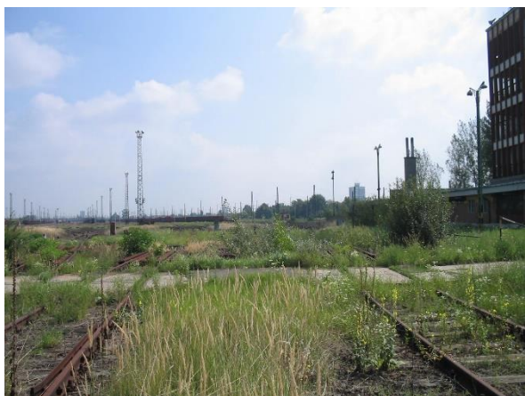
1. sz. nyaláb használaton kívüli lyrája Budapest felől

Bontás: 10818 vm vágány, 24 csop. kitérő