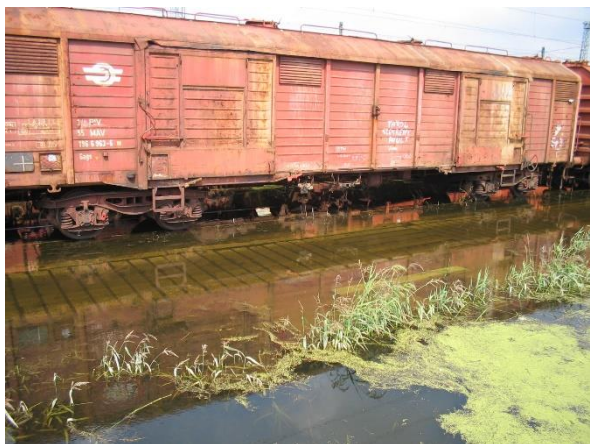
Víz alatt lévő vágányoka helyreállítás előtt (1)