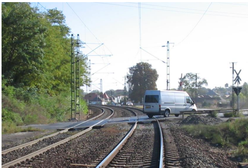
Strail burkolatú átjáró