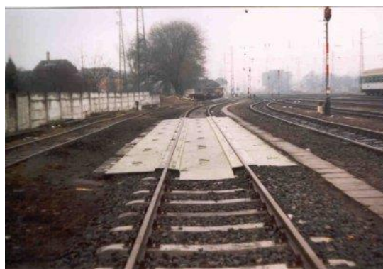
21 mh Green Track tálca beépítés után