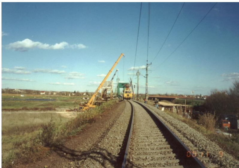
Sió híd a csatlakozó vágányszakasszal Dombóvár felől

1250-2001 Csepel Művek területén, a 108. sz. „Fúrócső” vágány üzembe helyezése Univer Trans Kft.