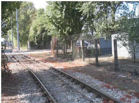
Átépített 34. sz. Tranzit bejárat vágány bejárat íve