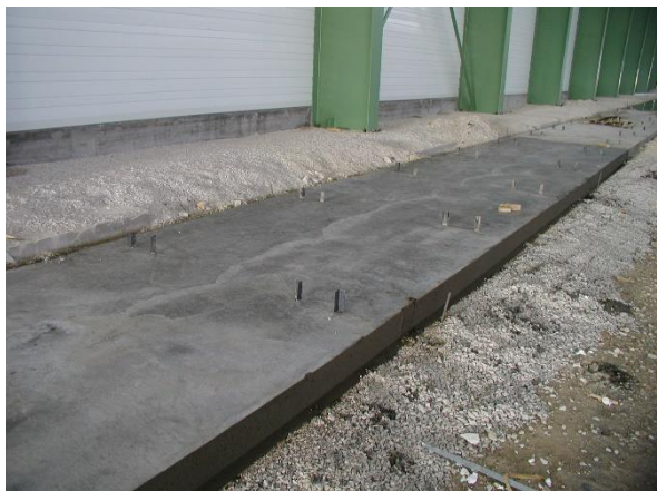
Csarnoki vágány vasbeton alaplemeze