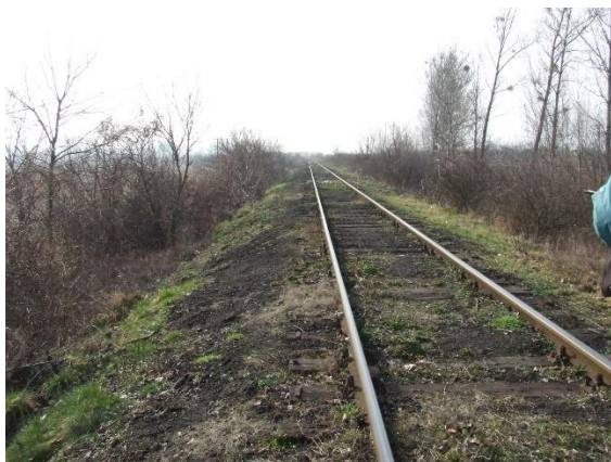
Összekötő széles vágány átépítés előtt