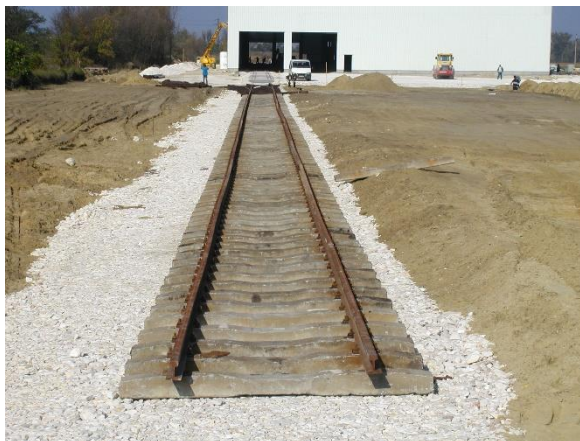
Csarnokon kívüli vágány építés közben

1366-2005 Vértesi Erőmű oroszlányi ip. vg. hálózat bontási, átalakítási terve