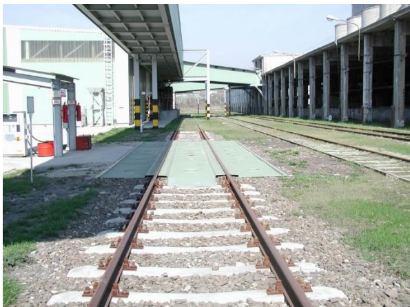
12,32 mh Green-Track tálca

Lecsöpögő olaj felfogására alkalmas 12,32 mh GreenTrack kármentő tálca beépítése