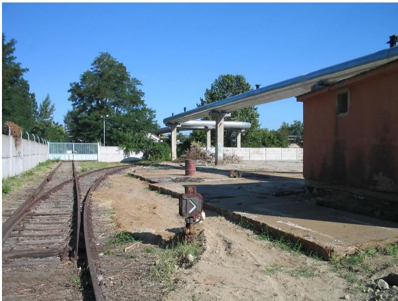
Összekötő vágány kiágazás a 124. sz. vg. felől

244 vm vágány, 2 csop. kitérő használatbavételi engedély meghosszabbítás