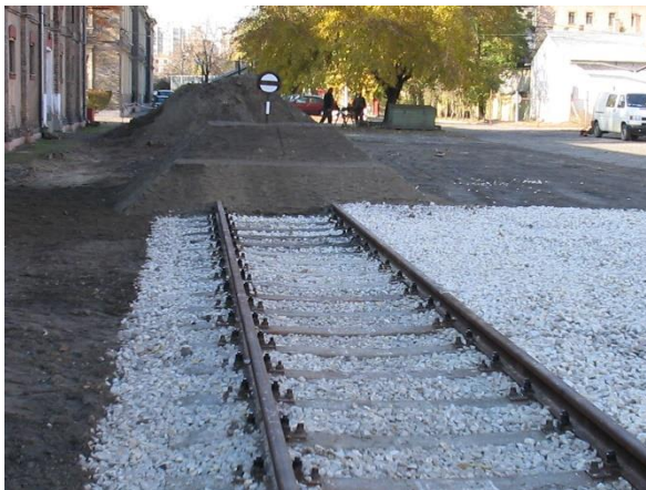
Átépített HM iparvágány vége földkúppal lezárva

1298-2003 Bp. Mag u. 3. szám alatti – 123; 124.b. sz. és összekötő iparvágány engedélyezési terve