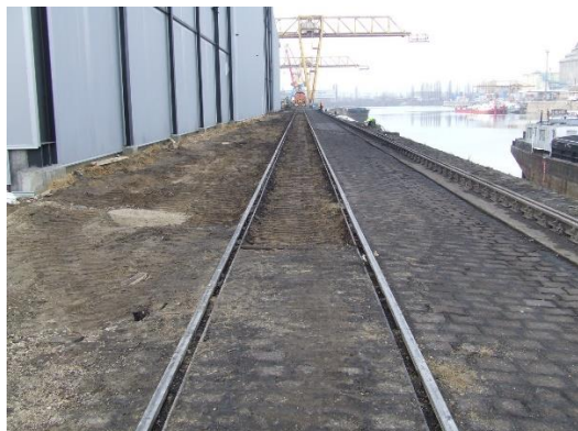
5. sz. Nyíltrakodói I. vágány átépítés előtt