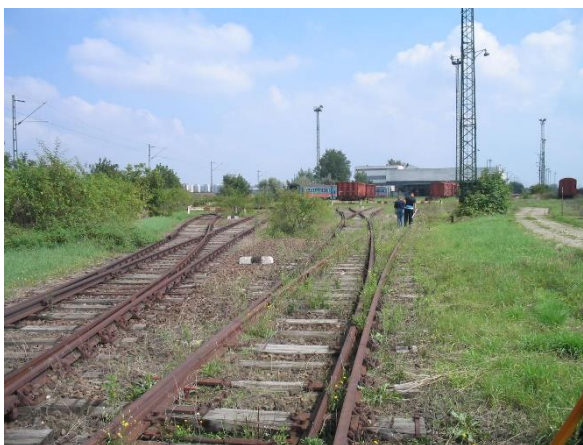
6. sz. nyaláb használaton kívüli lyrája Budapest felől

Közüti csomópont átépítéséhez kapcsolódó 60 vm vágányátépítés, 19,20 mh burkolt utátjáró építés fénysorompó bővítéssel és közúti forgalomirányító jelzőlámpával