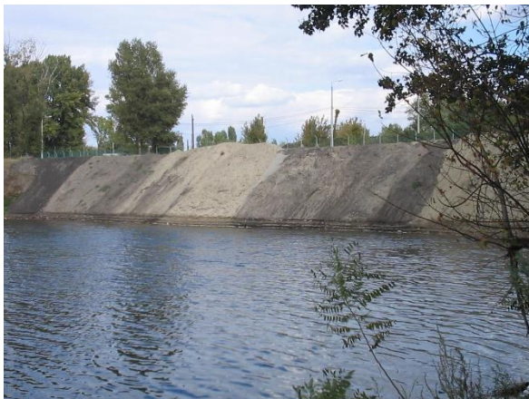
Partfal építés a 34. sz. Tranzit bejárat vágány mellett

1346-2004 Pécel – Isaszeg vonalszakasz 275+50,60 szelvényében útátjáró átépítéséhez egyesített tervek 12,60 m sz. STRAIL burk. átjáró átépítése 14,40 m sz-re mindkét vágányban, 825 m 2 csatlakozó útszakasz átépítése