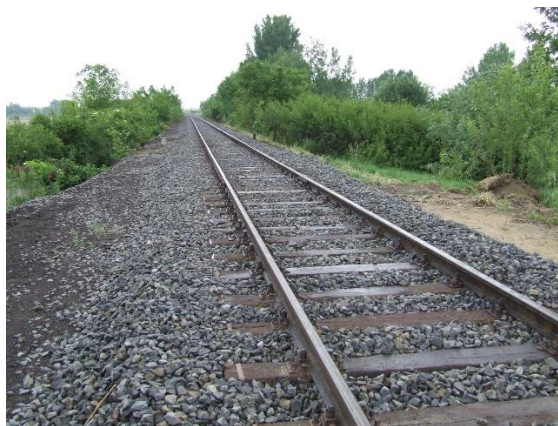
Összekötő széles vágány átépítés után