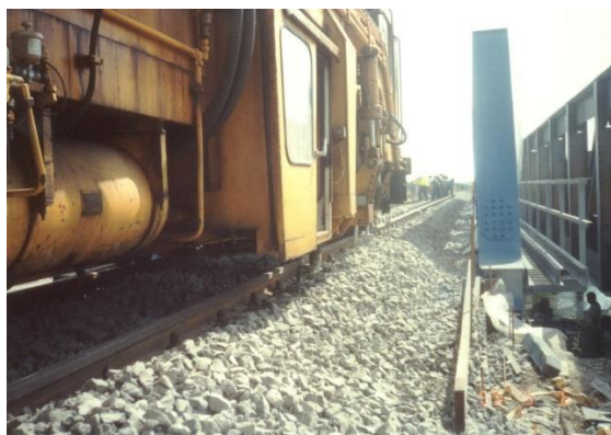
Vágányszabályozás az átépített hídon