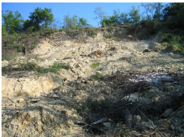
Megcsúszott rézsű a vágányok felől nézve

Rézsűmegtámasztás 110 m 2 , töltésepítés 105 m 3