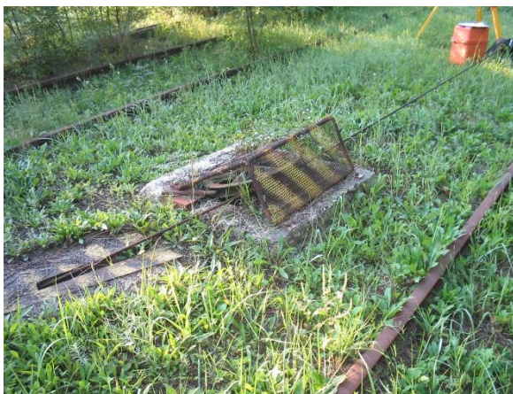
Bontandó vagonvontató berendezés