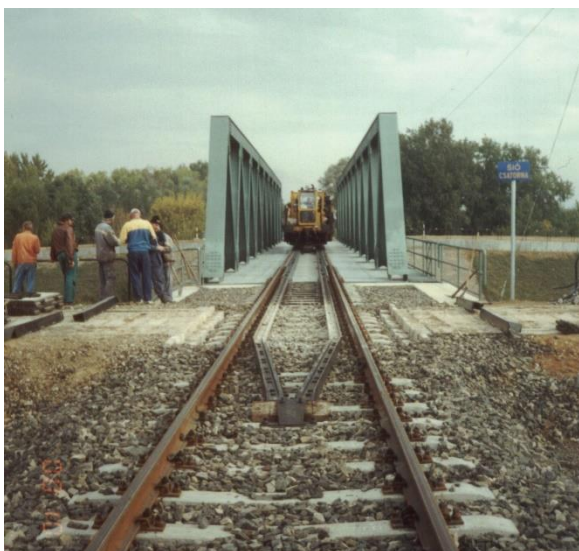
Sió híd a csatlakozó vágányszakasszal Szekszárd állomás felől