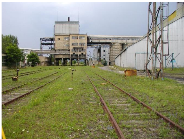
Bontandó szénosztályozó vágányok