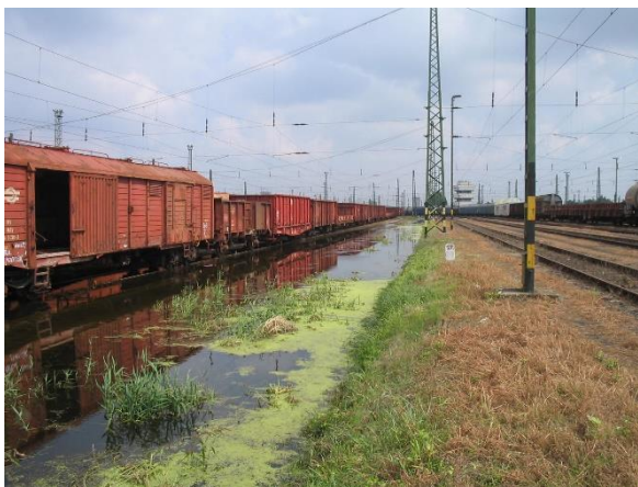
Víz alatt lévő vágányoka helyreállítás előtt (2)

1402-2006 Gödöllő, rézsúcsúszás helyreállítása