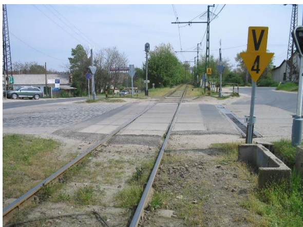
Major (Hunyadi J.) u.-i HÉV átjáró Budapest felől átépítés előtt