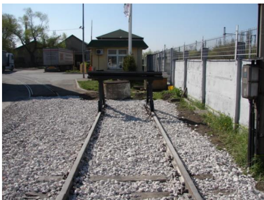
Újonnan épített vas ütközőbak

1419-2007 Csepeli HÉV és a Budapesti Szabadkikötő „Kültelki” fővágány vasúti átkötésének megtervezését