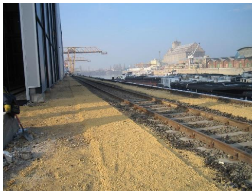
5. sz. Nyíltrakodói I. vágány átépítés után