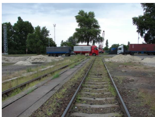
3. sz. Nyíltrakodói III. vágány átépítés előtt