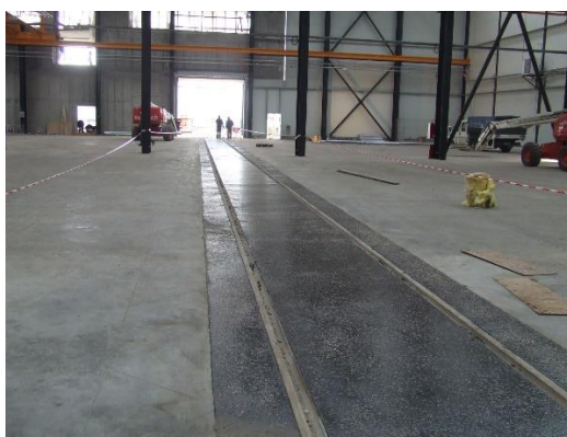
3. sz. Nyíltrakodói III. vágány átépítés után csarnokon belül