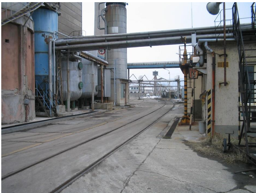
IV. sz. vg.