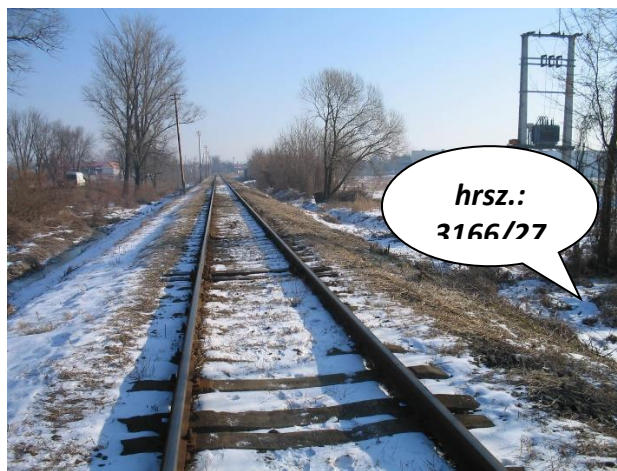
Vác – Balassagyarmat vasútvonal 585/586 szelv.

1394-2006 Budapest – Cegléd – Szolnok – Lökösháza vasútvonal átépítésével kapcsolatosan, a Budapest-Ferencváros – Vecsés vonalszakaszon iparvágányok bontási terveit. (Pestlőrinc)