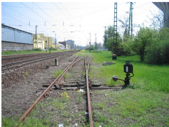
Bontandó ÉM-21. sz. vg. kiágazás

Bontás: 1283 vm vágány, 5 csop. kitérő, 2 db ütközőbak