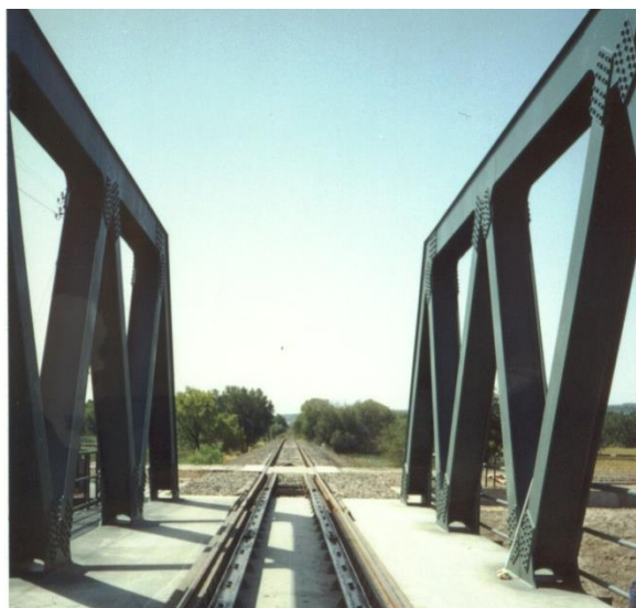
Sió híd a csatlakozó vágányszakasszal Szekszárd állomás felé