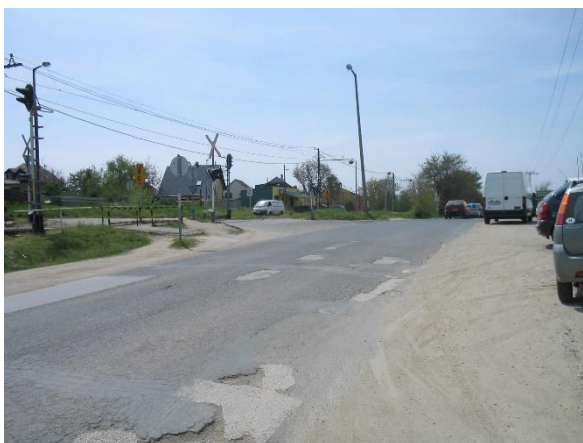
Major u. - Hunyadi J. u. csomópont átépítés előtt