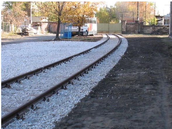
Átépített HM iparvágány bejáratí íve