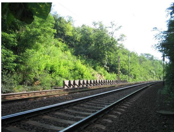
Vasúti pálya védelme ideiglenes pódiummal a helyreállítás előtt