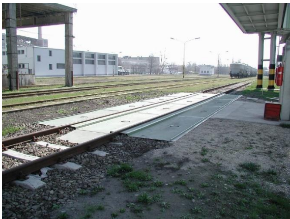
12,32 mh Green-Track tálca

1212-2000 Mózsh-Szekszárd közötti vonalszakasz 520+90 szelvényben lévő Sió-híd és csatlakozó pályaszakaszok átépítésének pályaeépítésének vágányépítési terve